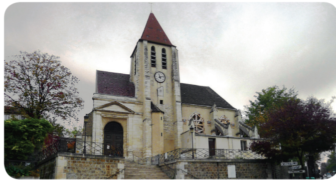
Eglise Charonne - cc - Mbat