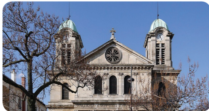
Eglise St-J-C de la Villette