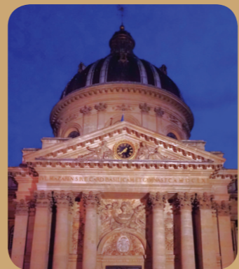
Panamée mars 2024 - Jean-Pierre Guinot