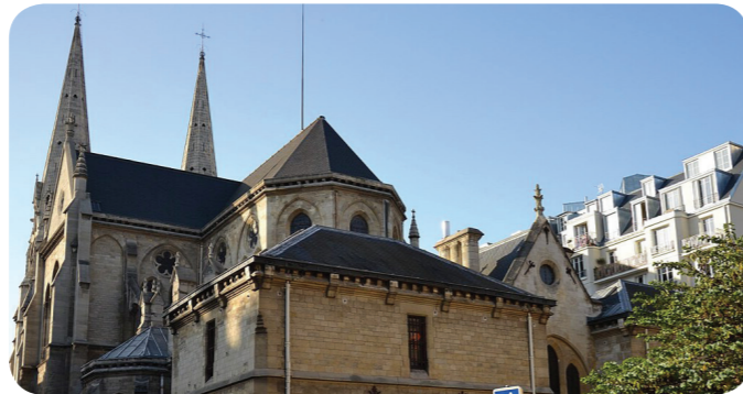
Eglise St-J-B de Belleville